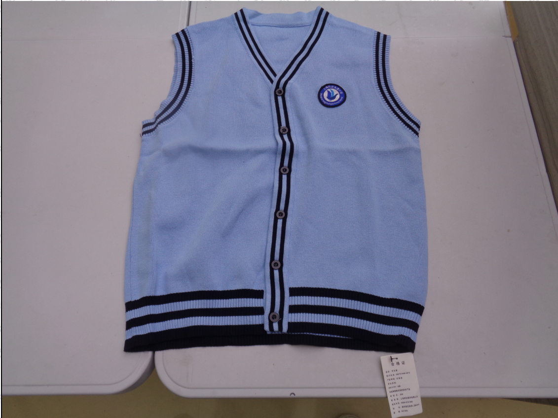
蓝/藏青色针织开衫马甲