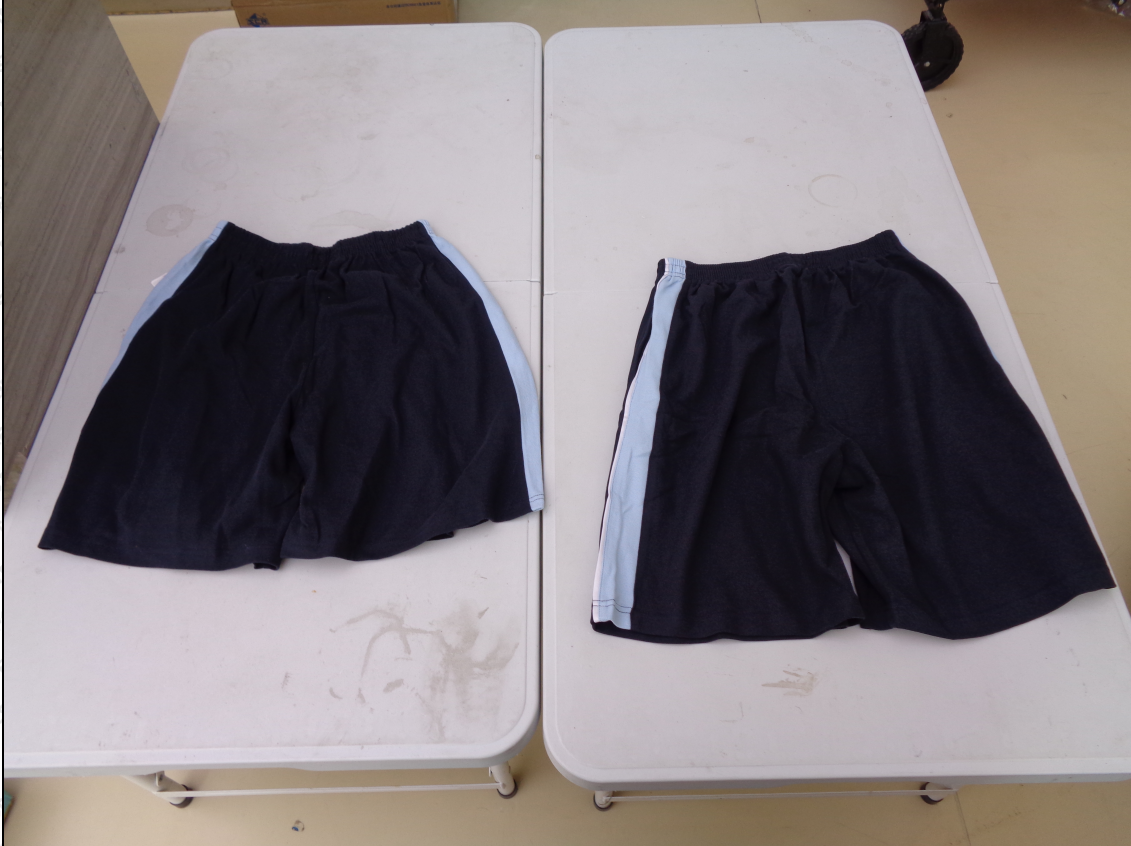
藏青色嵌蓝条短裤；藏青色嵌蓝条裙裤